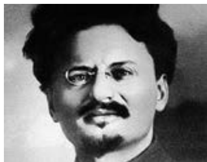
Leo Trotzki – schrieb die Urfassung des Zimmerwalder Manifests.