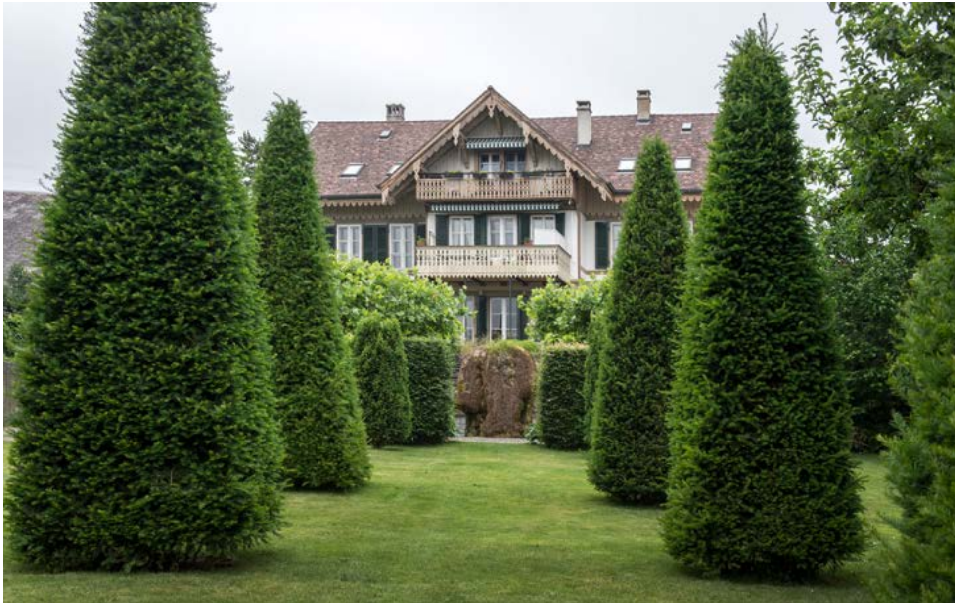
Hinter diesem satten Grün versammelte sich 1915 die «Rote Gefahr». Aber nichts am einstigen Hotel Beau Séjour in Zimmerwald erinnert ans bewegte Kapitel Weltgeschichte.

Zimmerwald erhielt Strahlkraft, ohne dies zu wollen. Der Ort wurde weltberühmt, zumindest in der sozialistischen Welt. Aber auch im Putzger-Geschichtsatlas, einem unverdächtigen deutschen Standardwerk, war auf den Karten über die Zeit des Ersten Weltkrieges ein einzi-